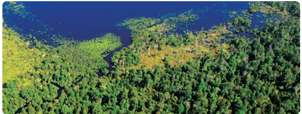
APP亞洲漿紙將協助保護及復育100萬公頃印尼熱帶雨林

為邁向綠色永續未來，APP亞洲漿紙（Asia Pulp & Paper，簡稱APP）於4月28日宣佈將藉由全面性地表永續發展評估，投入保護與復育100萬公頃印尼熱帶雨林計畫。此劃時代的重大創舉獲得世界自然基金會（WWF）、綠色和平（Greenpeace）及APP解決方案工作小組內的NGO成員等相關團體支持，將更妥善保護APP供應鏈內特許林地及其周圍地表環境。