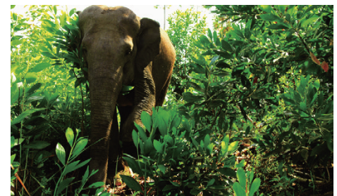
印尼廖內省Giam Siak Kecil區的大象為APP亞洲漿紙重點保育動物之一

位於蘇門答臘島占碑省的30 Hills地區（Bukit Tigapuluhe國家公園）。具體實施內容包括：加強動物通道走廊的保護以防止非法盜獵、保護Tebo Multi Agro特許林地中面臨威脅的大象群，及在WKS特許林地建立一動物走廊，以連接森林中重要的動物棲息區域，展開可行性評估。此外，APP亦發佈其它九大地表區域保護重點。