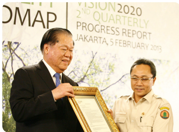
APP集團總裁黃志源向印尼林業部長H.E. Zulkifli Hasan遞交APP新「森林保護政策」