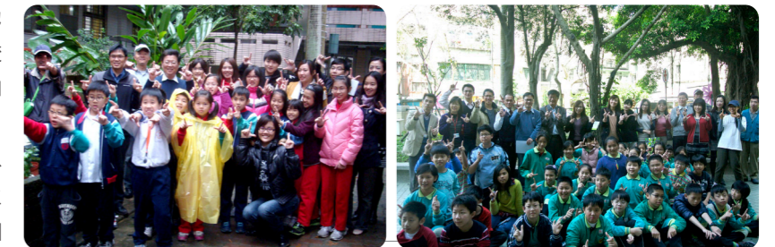
APP亞洲漿紙、珍古德志工、新北市新店中正國小以及臺北市民生國小師生攜手合作創建原生生態園

APP與國際珍古德協會合作的「校園綠拇指計畫」為國際珍古德協會「根與芽計畫」的一部份；自1991年起，全球已有超過100個國家、12,000個根與芽小組成立，其中臺灣就有超過700個小組；目的是希望藉由幼稚園到大學學子的親身參與，加強對生物的尊重與關懷，鼓勵關懷保護環境之心。