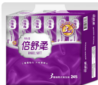
倍舒柔Angel Soft 3層抽取式衛生紙使用國際級高品質原紙，柔軟強韌

金盛世紙業以「種六棵樹，用一顆樹」為原則，所有紙類產品皆使用科學管理人工林紙漿，用心實踐綠色循環，為維護自然生態。