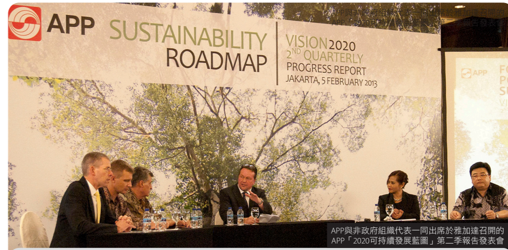
APP與非政府組織代表一同出席於雅加達召開的APP「2020可持續發展藍圖」第二季報告發表會